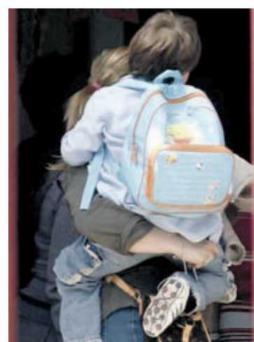
Mamma in fuga con tre bambini

CONDANNATA A DUE ANNI DONNA RESIDENTE IN VALLESINA LA DENUNCIA DEL CONIUGE CHE PER CERCARE I BIMBI È STATO ANCHE ARRESTATO